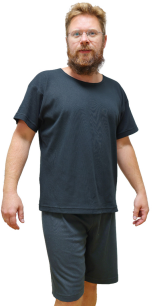
YSHIELD® TBT + TBH