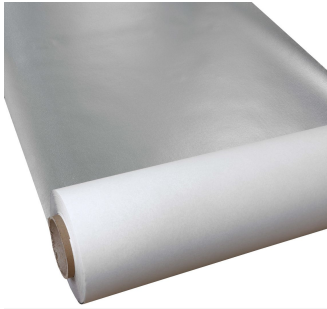
YSHIELD® SAFEBUILD® K150